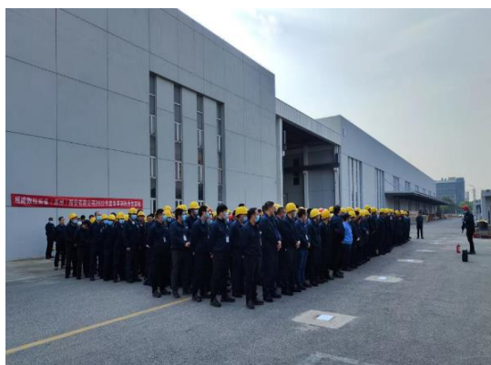
上图：消防安全演习