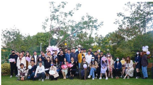
上图：单身联谊活动