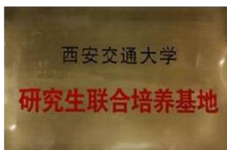
上图：大学生实践基地揭牌

未来，校企合作形式除了实践基地等形式以外，还会逐步推广到建立专业课程、改革现有人才培养模式等，以此促进学校和企业的共同成长。