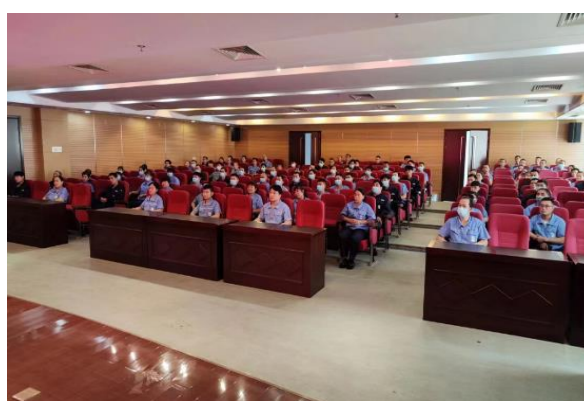
上图：消防安全培训