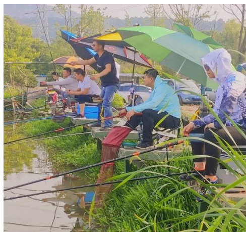
上图：纽威数控钓鱼比赛