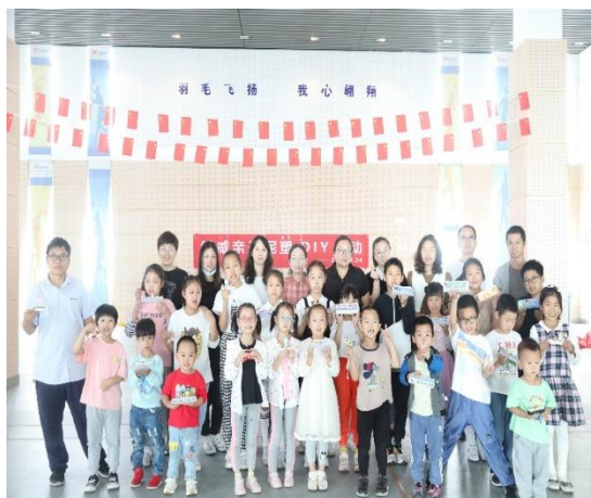
上图：亲子泥塑活动