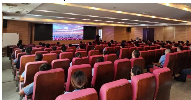
上图：学习二十大会议精神

同时，公司党总支在全年党建工作中积极开好党委会、理论中心组学习会和民主生活会三个会议，充分发挥党总支“把方向、管大局、保落实”和“两个核心”作用，把党的领导融入公司治理各个环节，严防各类风险发生。