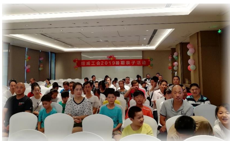
上图：工会暑期亲子活动

2022 年度，公司工会组织通过大力开展安全生产、职业培训和劳动竞赛等各种活动努力提高青年员工思想、业务素质。坚持以人为本，创新发展，及时调解内部矛盾；建立员工多种诉求渠道，积极倾听员工意见和建议；加强制度建设，大力创造和谐劳动关系，切实维护好职工的合法权益，实实在在为员工做好事、办实事。公司还十分重视员工的福利建设，如“三八节”、“中秋节”、“春节”等传统节日，向员工发放精美礼品；与苏州高新区企业、党团委机关、枫桥街道亲情联谊，组织朗诵比赛、羽毛球赛、钓鱼比赛等等。