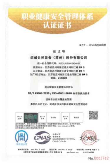
上图:职业健康安全管理体系证书