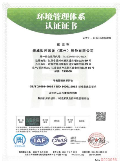
上图:环境管理体系证书