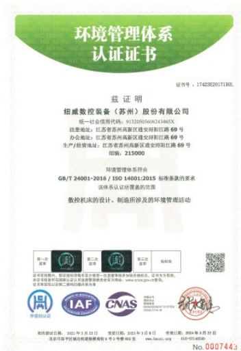
上图:环境管理体系证书

级全年实现水性漆替代油性漆 20%，2024 年有望实现 80%替代，将大幅减少非甲烷总烃的排放。2023 年通过变频改造等实现年节能 42.1 万 KWH，相当于减少排放二氧化碳当量 296 吨。2023 年三期厂房屋顶太阳能项目正式投入使用，实现年产清洁电能 423 万千瓦时，减少二氧化碳排放 3320 吨。