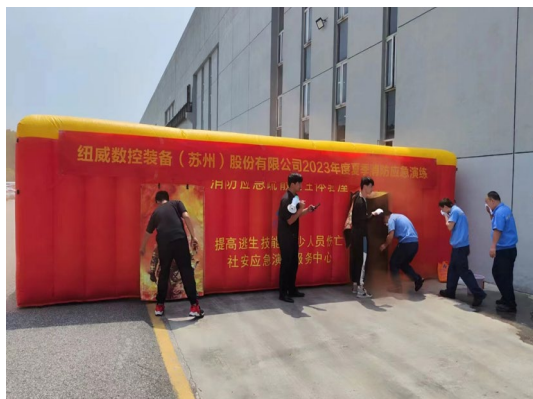
上图: 夏季消防逃生屋体验