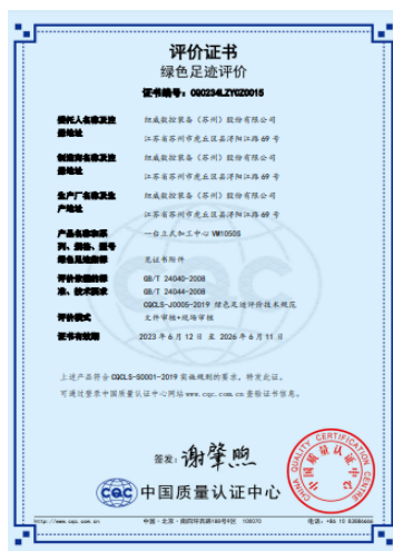
上图:产品绿色足迹评价证书