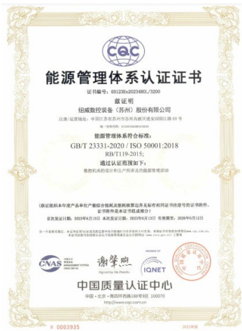
上图:能源管理体系证书