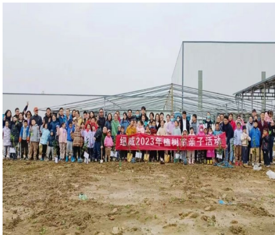
上图：亲子植树活动