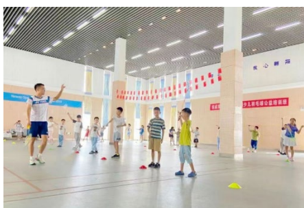
上图：纽威暑期少儿羽毛球培训班

工会成立以来，不断健全和完善内部管理，尽最大可能保障员工权益，增强企业凝聚力。公司职工代表大会民主选举产生了职工监事，为员工参与监督、管理公司提供了有效途径，充分保障了员工的合法权益。2023 年度，公司工会组织通过大力开展安全生产、职业培训和劳动竞赛等各种活动努力提高青年员工思想、业务素质。坚持以人为本，创新发展，及时调解内部矛盾；建立员工多种诉求渠道，积极倾听员工意见和建议；加强制度建设，大力创造和谐劳动关系，切实维护好职工的合法权益，实实在在为员工做好事、办实事。公司还十分重视员工的福利建设，如“三八节”、“中秋节”、“春节”等传统节日，向员工发放精美礼品；与苏州高新区企业、党团委机关、枫桥街道亲情联谊，组织朗诵比赛、羽毛球赛、台球比赛等等。