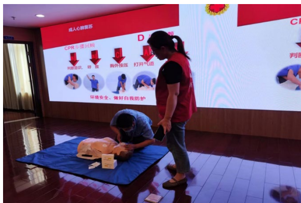
上图: 应急救护培训