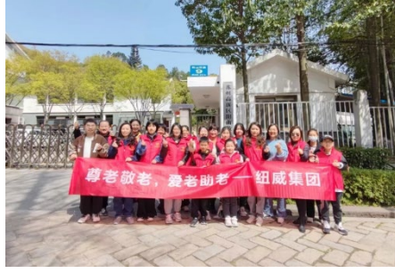
上图：尊老敬老活动