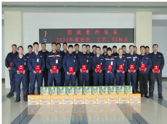
上图: 安全、工艺技术、5S 定期评比