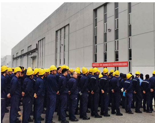
上图: 2023 年冬季消防演习

夏季消防演习还引入逃生屋体验，应急救护培训，有效提高员工自我保护能力，消除一切可能导致事故发生的因素，确保员工生命健康安全。在积极落实全员安全生产责任制的同时，公司也不断细化安全生产管理工作，2023 年公司顺利通过二级安全生产标准化审核。