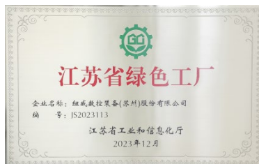
上图:江苏省绿色工厂