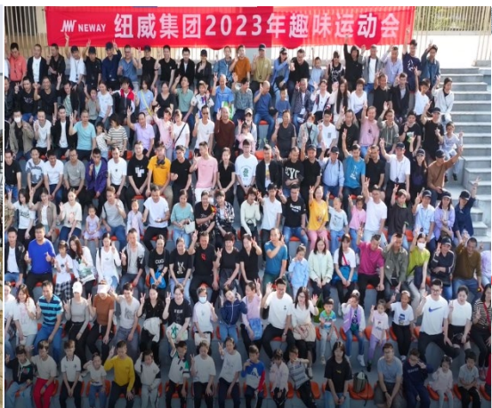
上图：2023 年趣味运动会