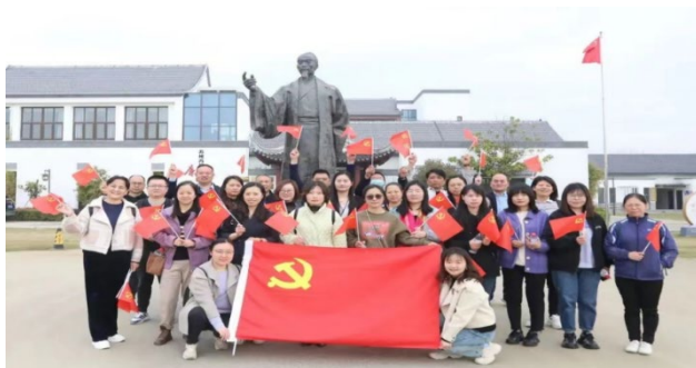
上图：党员参观冯梦龙村廉政教育基地

同时，公司党总支在全年党建工作中积极开好党委会、理论中心组学习会和民主生活会三个会议，充分发挥党总支“把方向、管大局、保落实”和“两个核心”作用，把党的领导融入公司治理各个环节，严防各类风险发生。