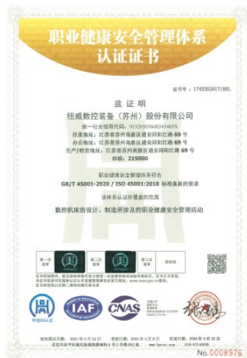
上图:职业健康安全管理体系证书