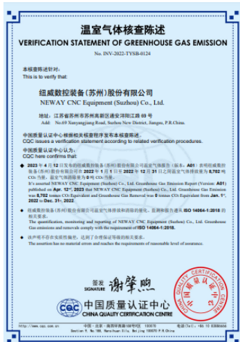
上图:温室气体核查证书