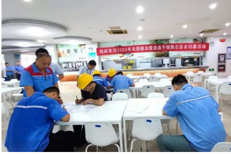
上图：无偿献血活动